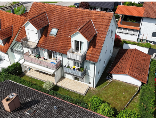
Garten inkl. Terrasse