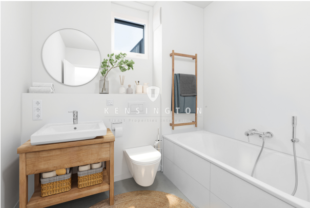
Bad mit Badewanne