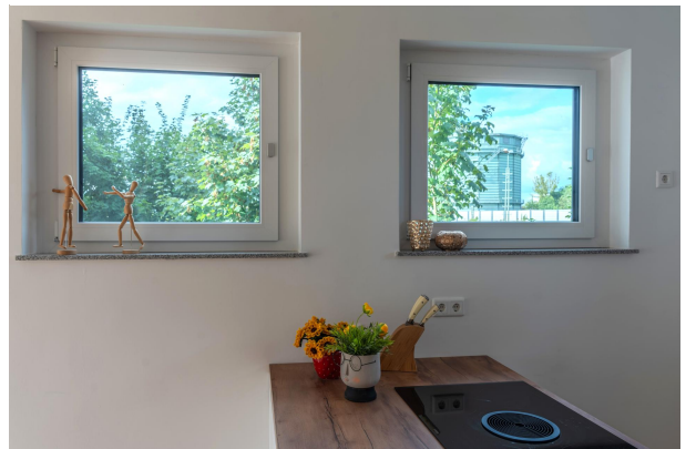
Detailfoto aus der Küche!