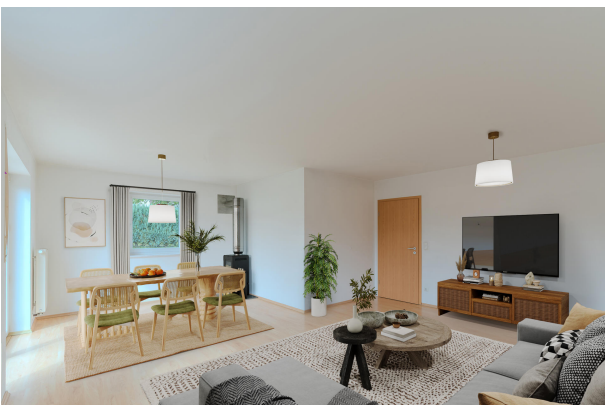
So könnte Ihr neuer Wohnbereich aussehen