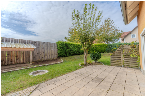
Feuerstelle, Platz für Tiere, Weintrauben uvm.!